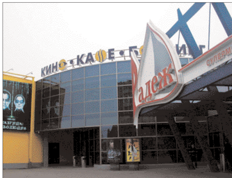
АННА ФЕОКТИСТОВА ДЛЯ СРЕ