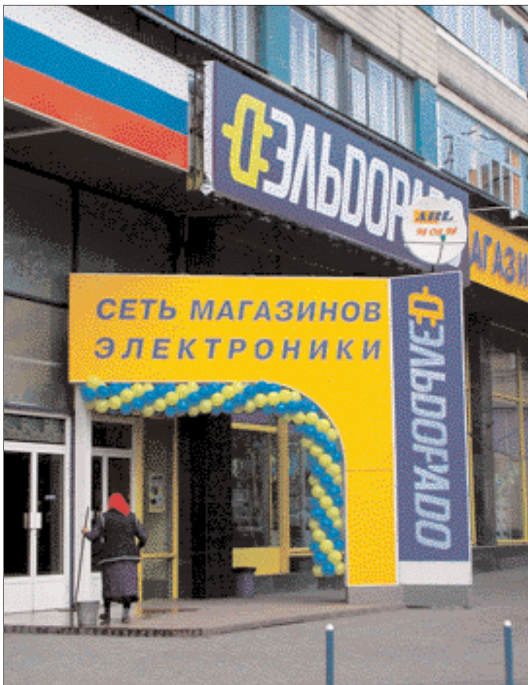
АННА ФЕОКТИСТОВА ДЛЯ СРЕ