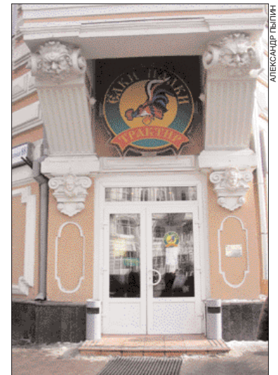
Сетевые в Ростове-на-Дону

На фоне большой доли сельского населения, транспортной загруженности и туристической популярности региона наиболее перспективными выглядят такие направления развития коммерческой