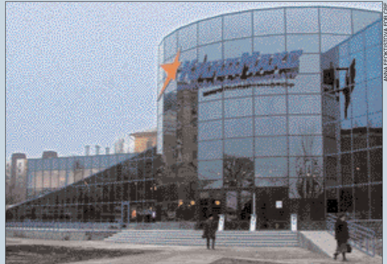
A cinema belonging to the Moscow 'Kinomax' chain in Volgograd

While Vorota is still in the planning stage, the Rostov Intourist Company is already building its International Convention Center. Stiles & Riabokobyloko rated the economic feasibility of the project in 2003. The first section of the projected building complex opened in September, 2004, and the former Intourist Hotel, has been remodeled and upgraded to four-star status. A seven-story retail and office complex will be constructed next, followed by conference facilities, a fitness center, an underground parking garage, a five-star hotel, and additional Class A offices. The total area of the