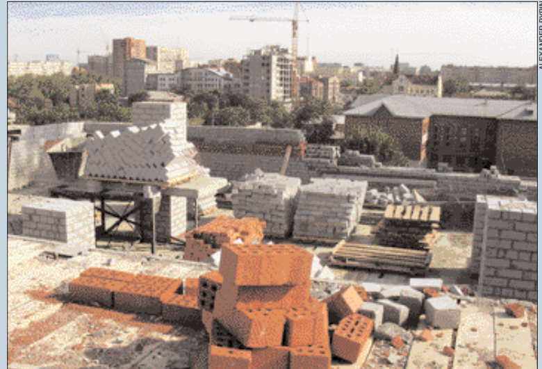
Chelyabinsk construction site

A number of projects involving office and commercial real estate will also be seen in cities such as Magnitogorsk and Surgut, that are less wealthy and more remote. It is important to note that many projects, particularly those in the retail sector, face a bleak future if oil prices should fall, as the buying power of the region will decline along with them. This same threat applies to a much lesser degree to warehouse projects along the