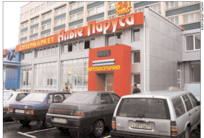
В Челябинске современные торговые центры пока отсутствуют

Впрочем, основной угрозой для успешности многих проектов на Урале становится не конъюнктура цен на