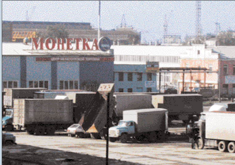
A 'Monetka' retail chain outlet in Ekaterinburg

In Ekaterinburg, the real estate boom is aided by its status as the local capital, its well-developed industry, and the efforts of the administration to create programs to develop the city and to lobby on behalf of its interests. With its investment and administrative resources, the municipal government helps local entrepreneurs and construction companies first, so that out of the huge number of projects already completed, those implemented with the par-