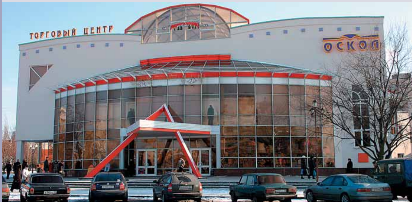
ТЦ «ОСКОЛ» В СТАРОМ ОСКОЛЕ.

➤ Воронежский холдинг «Мебель Черноземья» совместно с компанией «Рост-Ритейл» из Петербурга создает сеть разноформатных ТЦ «Интерيو»: проекты на различной стадии запущены в Воронеже, Белгороде, Липецке. Из иностранных фирм, помимо шведской Centrum Utveckling , в участии в проектах в регионах ЦФО замечены израильская компания Fishman Group (проект «Вернисаж» в Ярославле), турецкая KILIC Foreign Trade INC (проект «Липецкая ярмарка» в Липецке), немецкая ECE (проект в Ярославле).