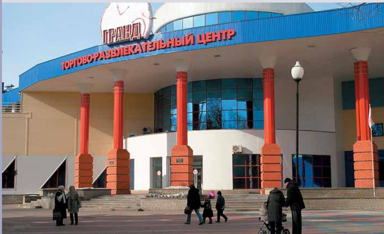
ТЦ «ГРАНД» в БЕЛГОРОДЕ.

➤ вило, является выгодное местоположение. Так, в Белгороде возводят современные торговые центры местные компании «Юкон» и «Белгородстроймонтаж», в Брянске владельцы Бежицкого универмага задумали его реконструкцию в современный торговый центр, в Старом Осколе торговые центры строят местные компании «Боше» и «КМА Проектжилстрой», в Твери у Парка Победы крупный проект площадью 60 тыс.кв.м реализует компания «Паллада-Инвест», в центре Владимира компанией «Стройспецмонтаж» строится ТЦ.