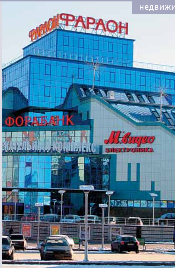
ТЦ «ФАРАОН» В ЯРОСЛАВЛЕ.