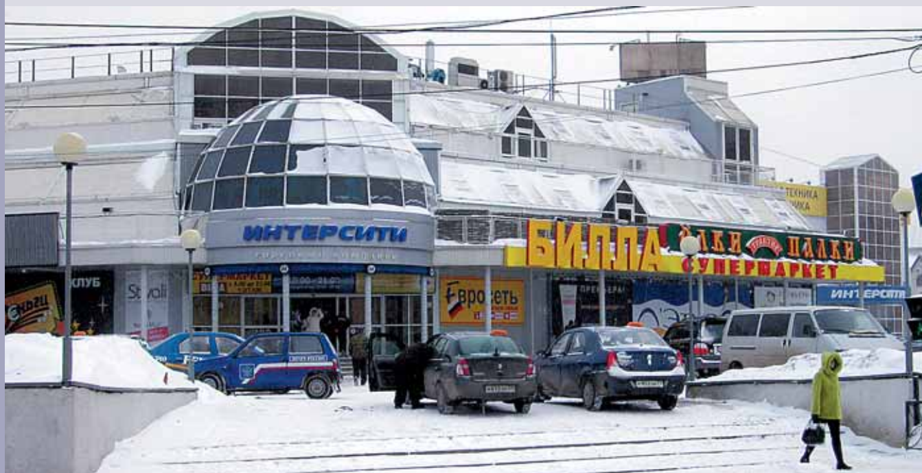
ТЦ «ИНТЕРСИТИ» В ТУЛЕ