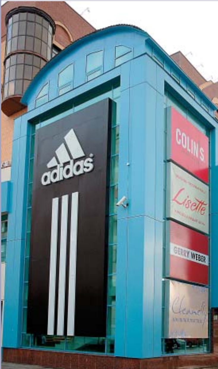
СПРОС НА МАРКИ-ЛЕГЕНДЫ НЕ СНИЖАЕТСЯ