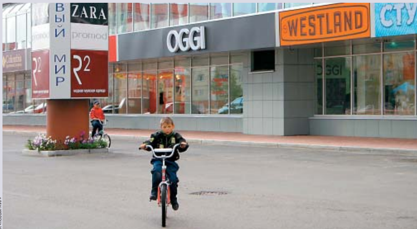
ТК «НОВЫЙ МИР»

В ЦЕЛОМ ДЛЯ ДЕЙСТВУЮЩИХ ТОРГОВЫХ КОМПЛЕКСОВ СУРГУТА ХАРАКТЕРНЫ НЕОПТИМАЛЬНАЯ ПЛАНИРОВКА, НЕОДНОЗНАЧНЫЙ ПОДБОР АРЕНДАТОРОВ, НЕРАЗВИТЫЕ ВЕРТИКАЛЬНЫЕ КОММУНИКАЦИИ, НЕСОВЕРШЕННЫЕ СИСТЕМЫ ВЕНТИЛЯЦИИ И КОНДИЦИОНИРОВАНИЯ.